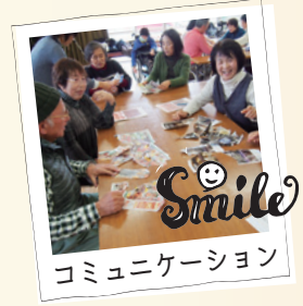
コミュニケーション