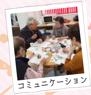
コミュニケーション